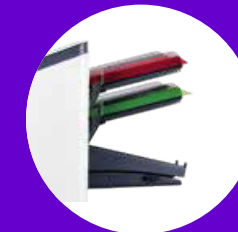
FPI 2720 → 2 Automatikstationen