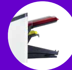
FPI 2715 → 1 Automatikstation → 1 kurze Zuführung für Beilagen