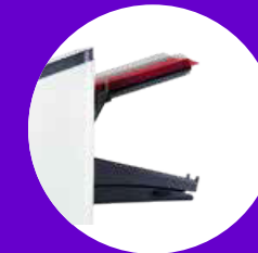
FPI 2710 → 1 Automatikstation