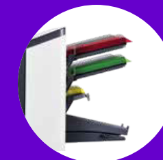
FPI 2725 → 2 Automatikstationen → 1 kurze Zuführung für Beilagen