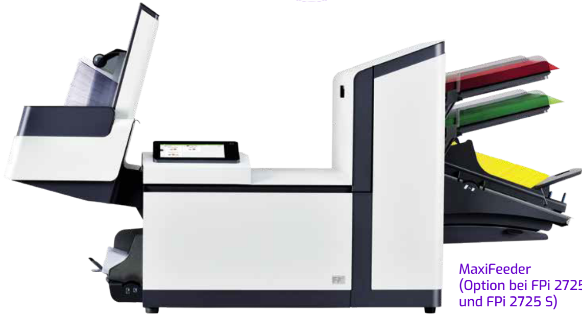
MaxiFeeder (Option bei FPi 2725 und FPi 2725 S) für Rückantwortkuverts oder Beilagen

Der CIS-Scanner (Option) liest ohne jegliches Justieren Steuercodes verschiedenster Art über die gesamte Blattbreite.